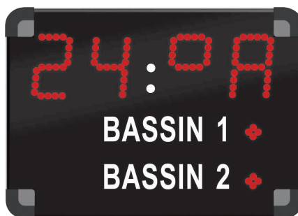
2 bassins • 0697ST