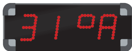
1 bassin • 0696ST