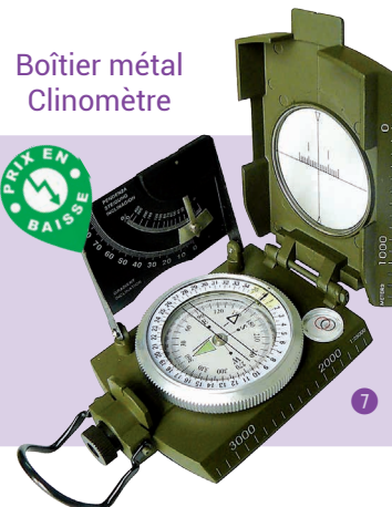
Boîtier métal Clinomètre