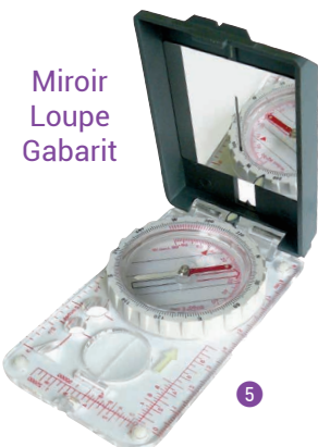
Miroir Loupe Gabarit