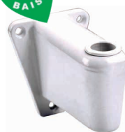
Support mural • 2815VE