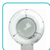
Circline 12 W Blanc froid