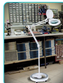
Pied 6 roues • 2818VE

► Pour 2810/2VE, 2812VE et 2813/2VE ► Métallique multi-appuis ► Hauteur totale 70 cm ► Base Ø 38x8,5 cm / 11 kg