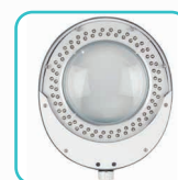
Circline 60 LEDs Blanc froid