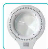
Circline 60 LEDs Blanc lumière du jour