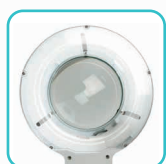
Circline 22 W Blanc chaud