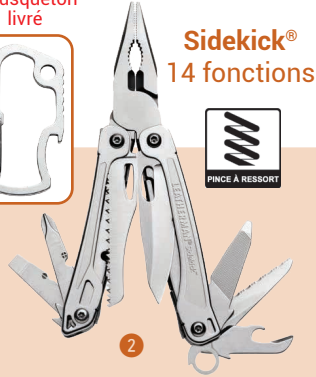
Sidekick® 14 fonctions