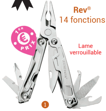
Rev® 14 fonctions