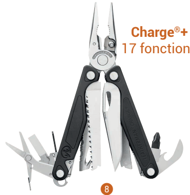
Charge+® 17 fonctions