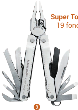
Super Tool® 300 19 fonctions