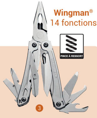
Wingman® 14 fonctions