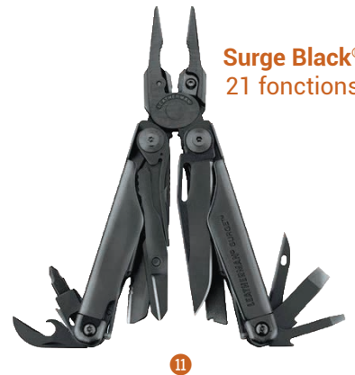
Surge Black® 21 fonctions