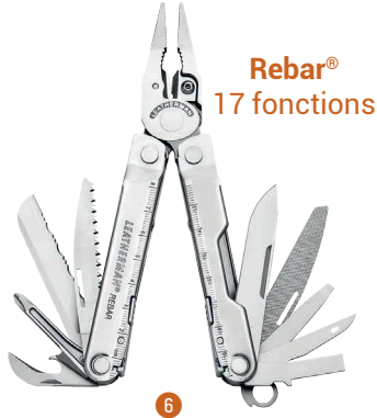
Rebar® 17 fonctions