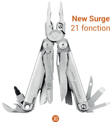
New Surge® 21 fonctions