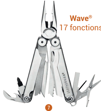
Wave® 17 fonctions