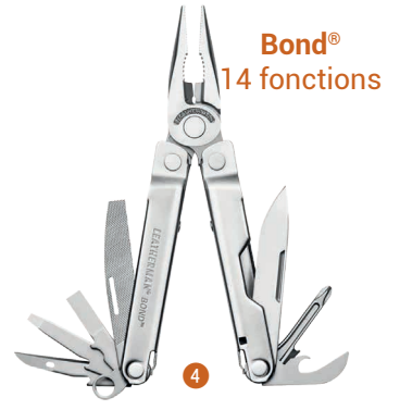
Bond® 14 fonctions