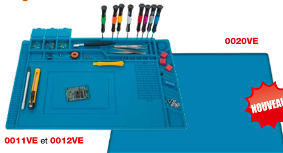
0011VE et 0012VE